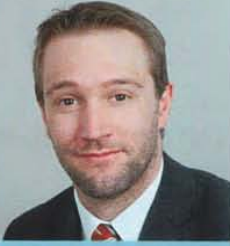
36 Jahre • Bettmar Selbständiger