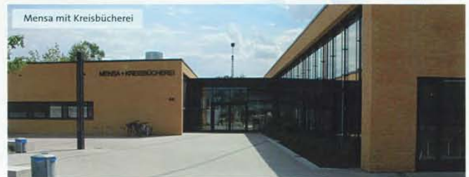
Mensa mit Kreisbücherei