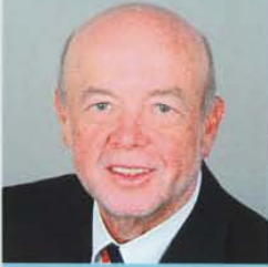
61 Jahre • Vechelde Kunststofftechniker I. R.