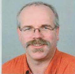
47 Jahre • Liedingen Logistiker