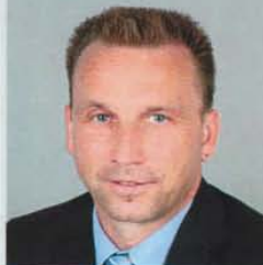
43 Jahre • Vechelde Dipl. Verwaltungswirt