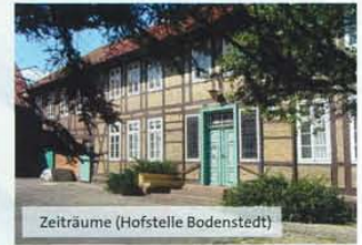
Zeiträume (Hofstelle Bodenstedt)