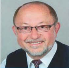
65 Jahre • Wedtlenstedt Wissenschaftler