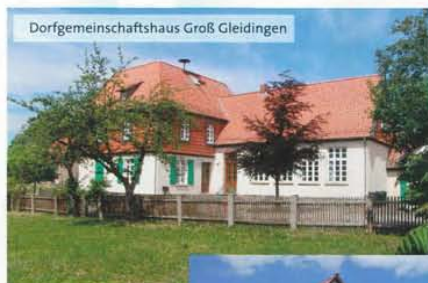
Dorfgemeinschaftshaus Groß Gleidingen