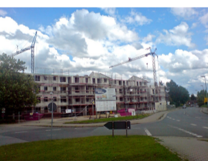
Betreutes Wohnen Vechelde

Das Feuerwehrkonzept wurde nicht nur von der Feuerwehr selbst erarbeitet, es kostet auch Geld. Dazu gehört nicht nur das neue Feuerwehrhaus Vechelde/Wahle, auch die anderen Ortswehren werden profitieren (Ausstattung und Fahrzeuge). Die SPD Fraktion wird dafür sorgen, dass im Rahmen der finanziellen Leistungsfähigkeit der Gemeinde nicht am Konzept gerüttelt wird, wie die CDU es will. Denn die Feuerwehr ist nicht nur einer der wichtigsten Kulturträger in den Ortschaften, sondern sie muss heutigen Ansprüchen (Tagesalarmsicherheit/schwere Unfälle) genügen können!