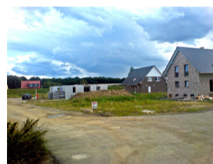
Baugebiet in Bettmar

Vechelde wird als Wohnstandort immer attraktiver. Wir haben die Baugebiete in Vechelde Süd, Vor dem Talwiesenkamp 1+2 ausgewiesen und damit den Wohnstandort gestärkt. Aber auch die kleineren Ortschaften wurden nicht vergessen. Mit angemessener Baulandentwicklung wie aktuell in Bettmar, Bodenstedt, Wierthe und Klein Gleidingen ermöglichen wir die Eigenentwicklung der Ortschaften.